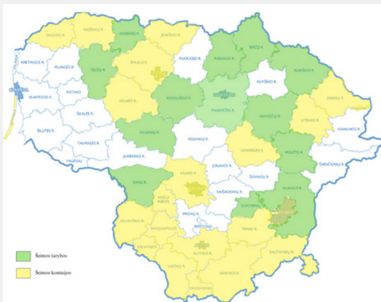
1 pav. 2024 m. Šeimos tarybų / komisijų žemėlapis